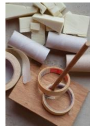
5: papieren tape, hout en hardschuim