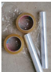
16: breed plakband en folie