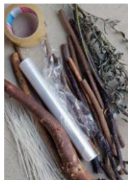
3: wilgentakken en binddraadjes