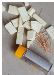
8: beeldhouwersschuim en satéprikkers