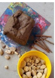
10: klei, grind, wol