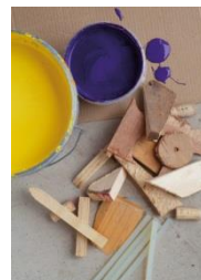
18: karton, afvalhoutjes, kurk