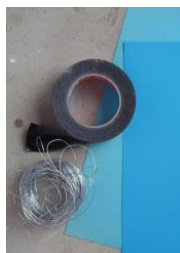
9: ijzerdraad en gekleurd karton