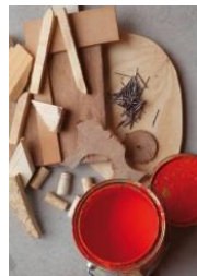
4: hout en spijkers