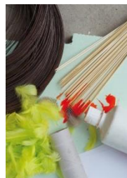
17: papier, karton en veren