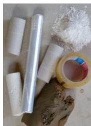
7: gips en klei