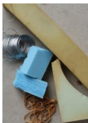
12: schuimrubber elastiek, ijzerdraad