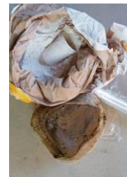
6: klei en gips