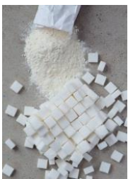
11: suikerklontjes en meel