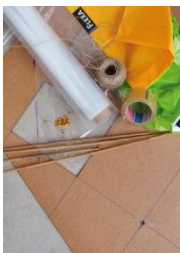
15: plastic folie, draagtassen