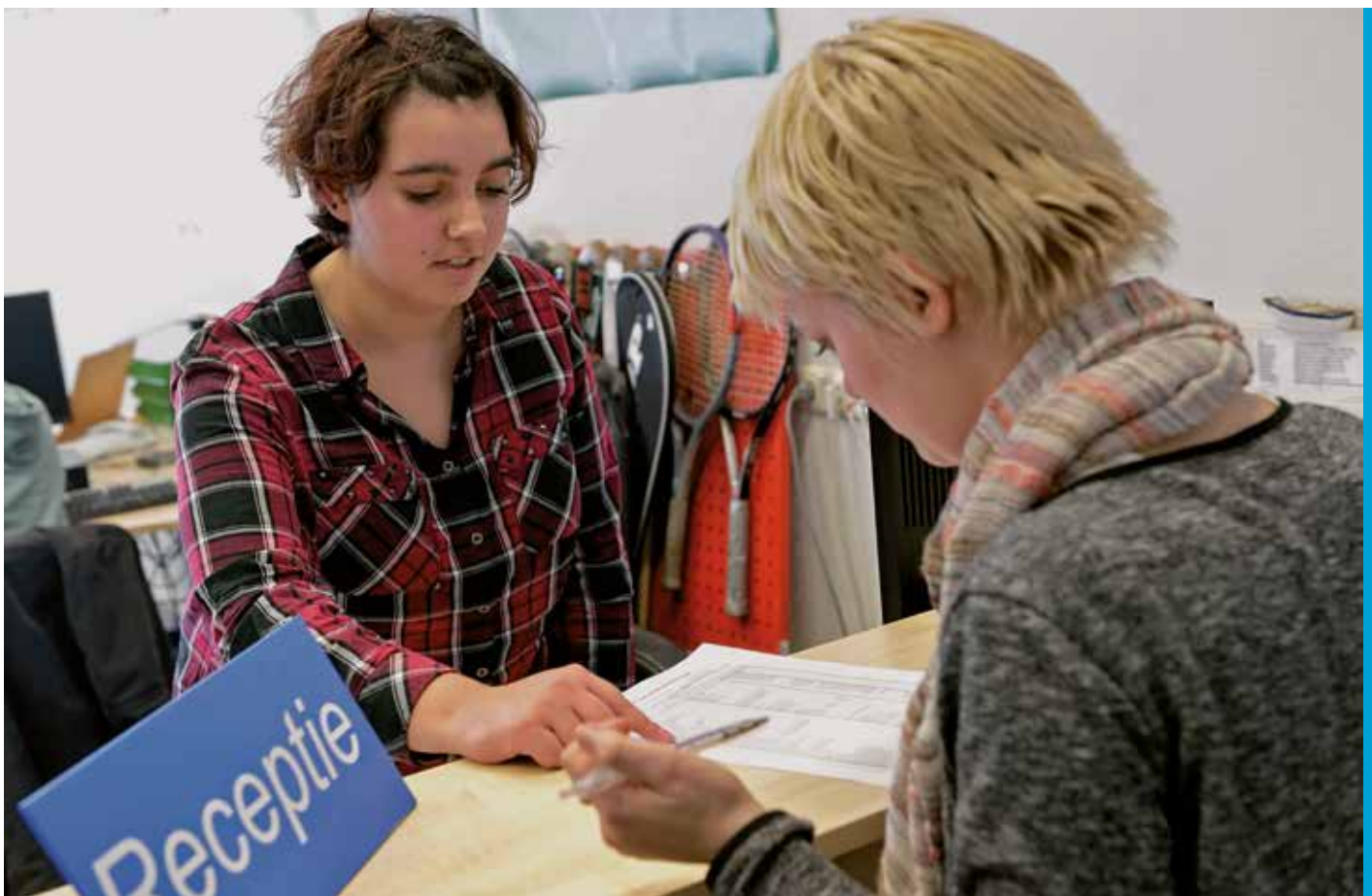
Cursisten in opleiding Administratie