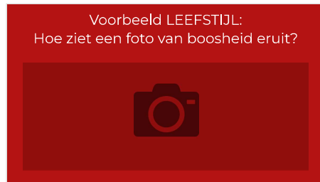
Slide 13 - Open vraag