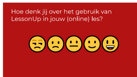
Slide 5 - Poll