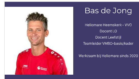
Slide 2 - Tekstslide