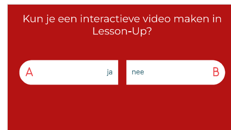
Slide 16 - Quizvraag