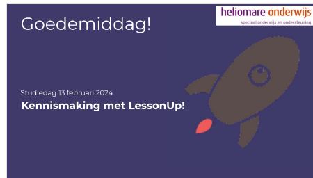
Slide 1 - Tekstslide