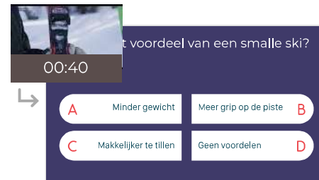
Slide 18 - Quizvraag