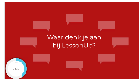
Slide 4 - Woordweb