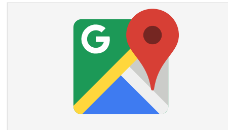
Slide 14 - Kaart