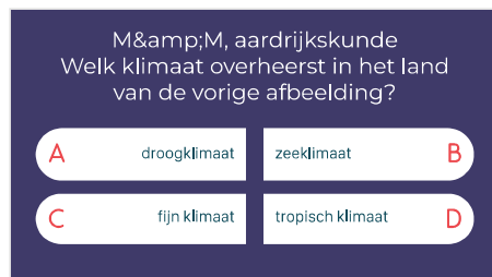
Slide 15 - Quizvraag